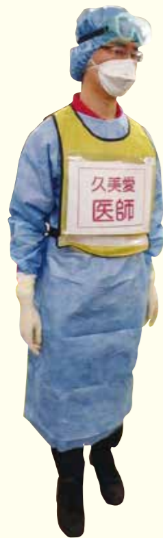
感染防護服の着用

9月6日に高山市総合防災訓練があり、当院では5名参加しました。毎年市内の各小中学校で開催されている訓練ですが、今年はコロナウイルス感染予防の為、3つの会場に分かれwebを活用し、“高山を震源とする最大震度7の地震が発生し西小学校に応急救護所が設営され、医療救護活動をする”想定で、行なわれました。