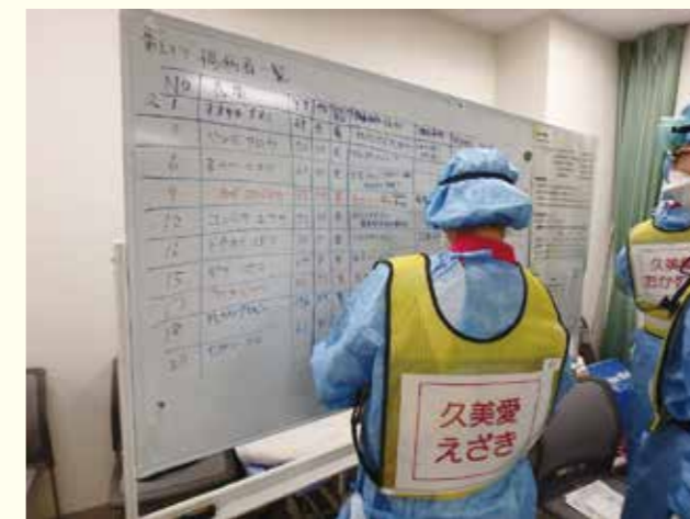
エリアごとの傷病者一覧と治療優先順位付け

災害はいつ起こるか解らないので備えが大切です。どんな事態であっても災害は待ってはくれません。今回の訓練は初めてwebを活用して行われましたが、参加者にとって貴重な体験となったのではないかと思います。今後も継続して訓練に参加し、多くのスタッフが災害医療の知識を身につけていく事が必要と思います。